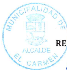
RENÁN CABEZAS ARROYO ALCALDE

Unidades Municipales – Equipo de Comunicaciones - SS.MM.